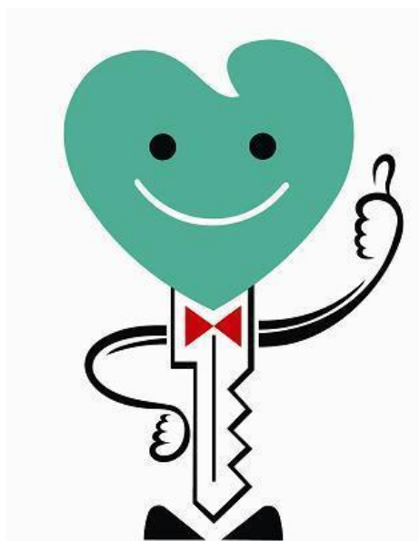
愛知県安全なまちづくりシンボルマーク “ アンキー君 ”